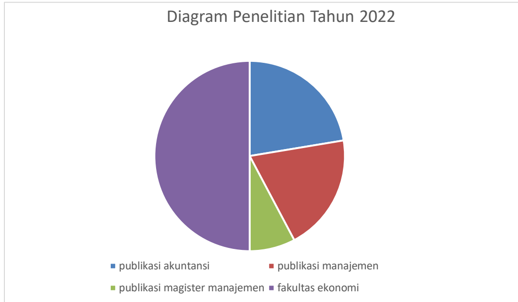
Diagram 1. Data Penelitian Tahun 2022

Dosen fakultas ekonomi selama Tahun 2022 telah melakukan berbagai penelitian dengan menghasilkan sejumlah 619 publikasi penelitian, diantaranya prodi akuntansi menghasilkan sebanyak 277 publikasi penelitian, pada prodi Manajemen 246 publikasi jurnal, magister manajemen 96 publikasi jurnal. Hal ini menunjukkan bahwa pelaksanaan penelitian sudah sejalan dengan visi keilmuan. Lebih lanjut, prodi akuntansi membentuk keserumpunan prodi untuk memastikan bahwa dosen dan mahasiswa melaksanakan penelitian sesuai dengan agenda penelitian dosen yang merujuk kepada roadmap Penelitian.